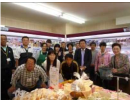
農家の集いオープン日