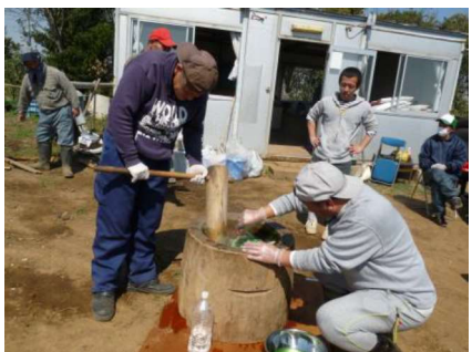
取れたてのよもぎを使ったお餅は最高においしい！！