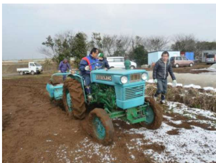
トラクターで何度も土を耕します