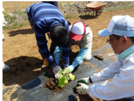
かぼちゃの苗植え