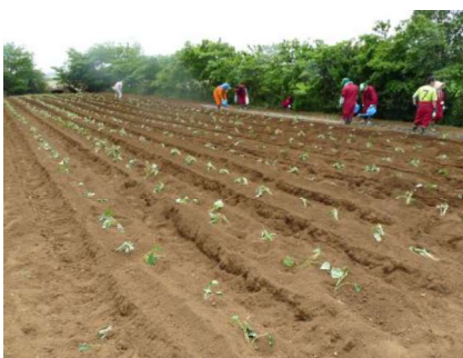
さつまいもの苗植え完了